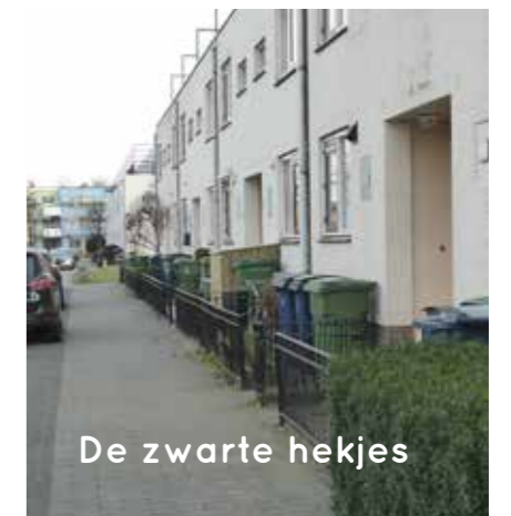
De zwarte hekjes

Door het ophogen van de straten en achterpaden ontstaat er hoogverschil met uw voor- en achtertuin. Als eigenaar van de woning moet u zelf zorgen voor het ophogen van uw achter- en voortuin. Wij adviseren u dit pas te doen nadat de stoep en het achterpad zijn opgehoogd, omdat u dan exact de ophoging ziet. U kunt tegen voordelig tarief zand bestellen bij aannemer Dusseldorp. Tuinaarde wordt gratis ter beschikking gesteld. Uiteraard ontvangt u hierover meer informatie voordat wij bij u in de straat gaan starten. Als u in een huurhuis woont, neem dan contact op met uw verhuurder over het ophogen van uw tuin.